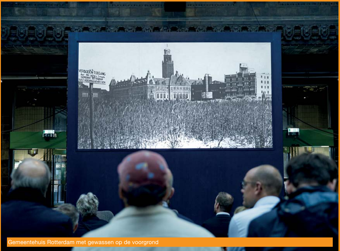
Gemeentehuis Rotterdam met gewassen op de voorgrond