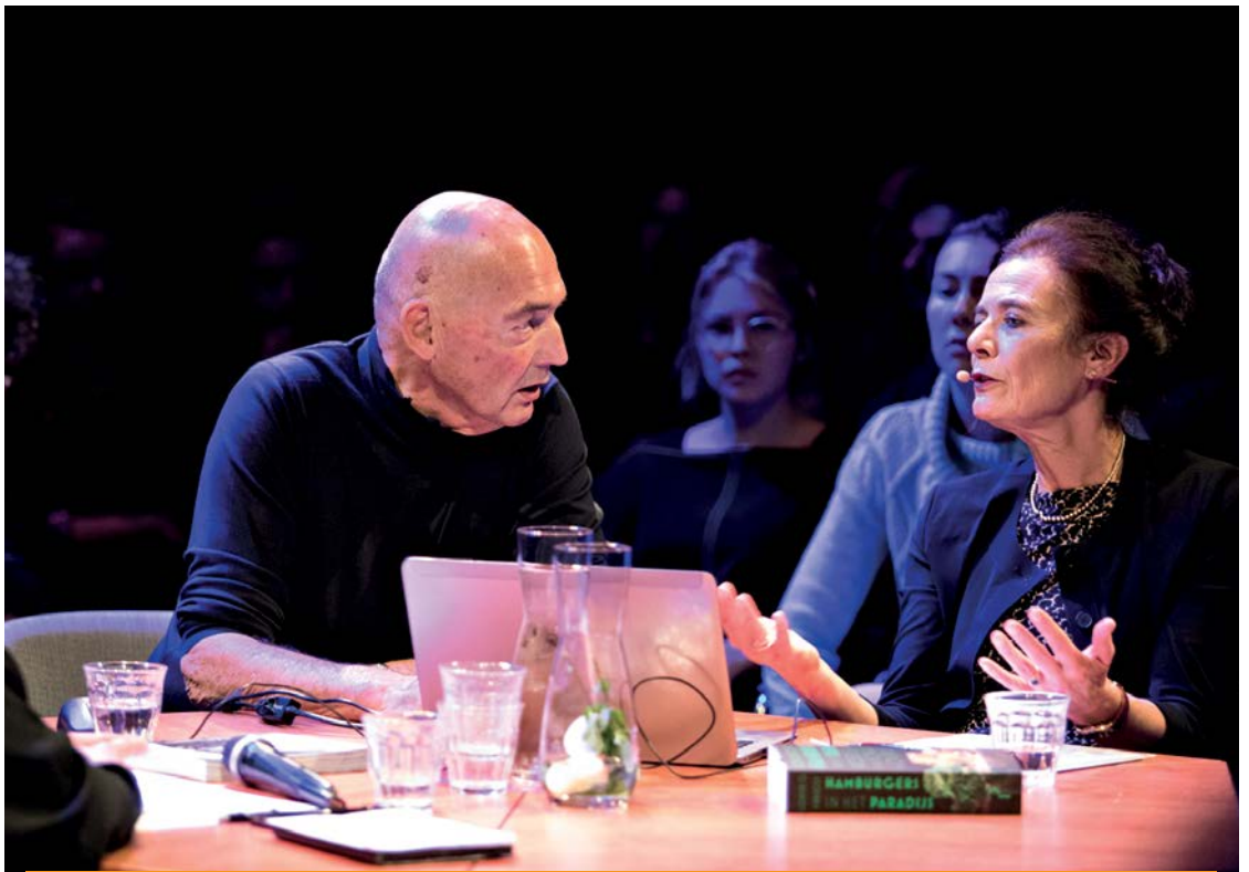
v.l.n.r. Rem Koolhaas, Louise Fresco