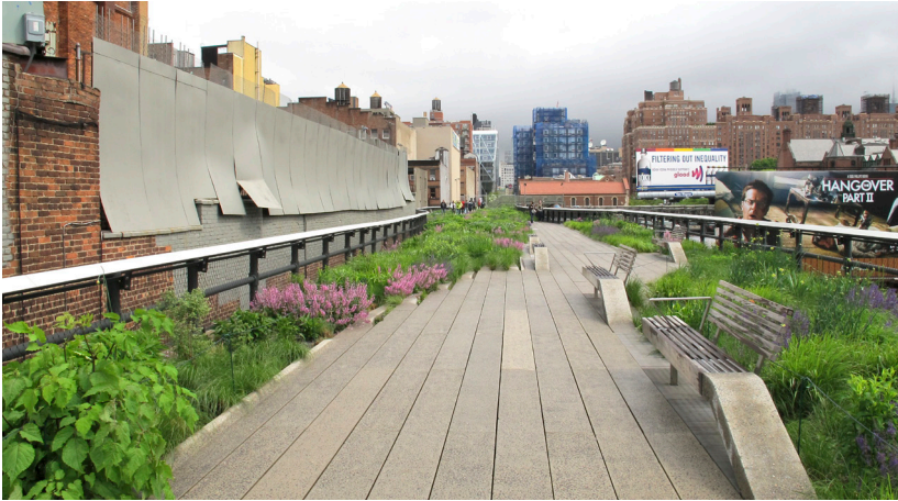
The Highline, New York samen met Field Operation landscape architects (2009)

rails overwoekert neemt hij als vertrekpunt, om het gevoel van de originele, ‘spontane’ planten vast te houden. De grassen - Amerikaanse soorten, geplant in ecologische groepen - zijn hier sterk door elkaar gemixt. Het geeft nog veel sterker dan in zijn tuinen, het idee alsof je midden in de stad in een stuk wilde natuur bent beland. Het is volgens kenners hét geheim achter het (wereldwijde) succes van The Highline; de grassen zijn cruciaal geweest voor dat effect.