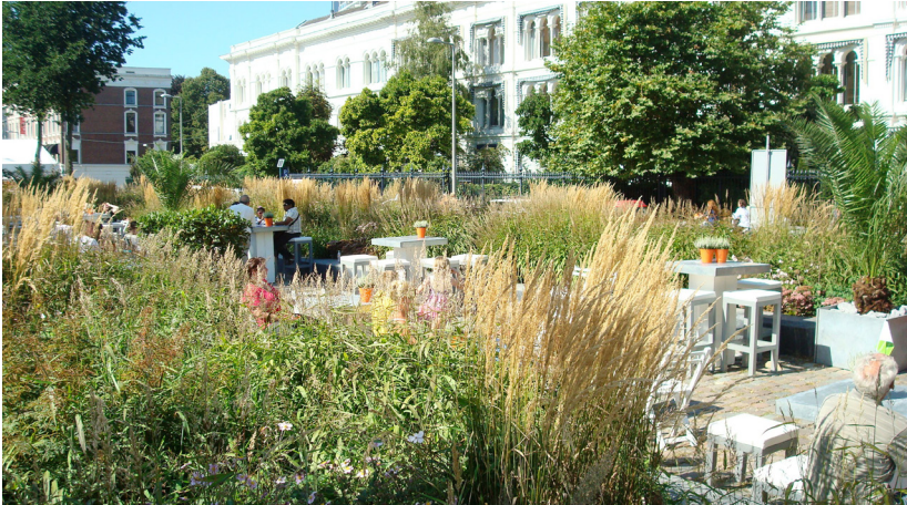
Westerkade in Rotterdam, 2011

Hummelo was voor de tuinontwerper een kans, bood met een lap grond van 4000 m 2 letterlijk nieuwe ruimte. Want Oudolf weet op dat moment al dat hij niet de klassieke tuinen wil maken zoals beschreven in zijn studieboeken. Hij wil een 'wildere' richting inslaan. "Toen ik begon draaide alles om de traditionele Engelse tuin. Het was een en al bloemen en kleur. Het was dogmatisch - doodlopend, eindig. Ik werd daar een beetje moe van." 2