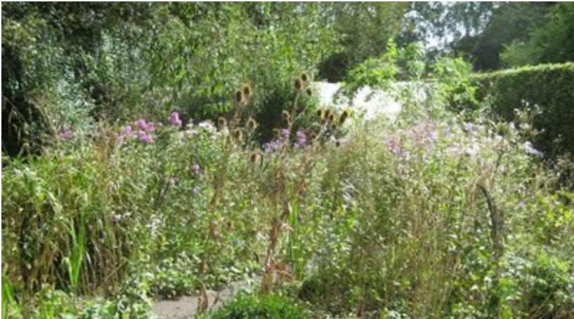
De Prionantuinen van tuinontwerper Henk Gerritsen

Terwijl planten traditioneel worden ‘teruggeknipt’ in de winter, zet Oudolf ze in als een volwaardig onderdeel van zijn ontwerpen. De winst van deze aanpak is niet alleen een tuin die twaalf maanden per jaar fraai oogt. De ontwerpen worden ook veel dynamischer, doordat ze de seizoenen volgen en over de jaren heen langzaam volgroeien. Ze zijn daarnaast minder onderhoudsgevoelig, wat ze ook op de lange termijn mooi (en betaalbaar) houdt. En dat kan uiteindelijk het verschil maken tussen een verwaarloosd stuk grond of een park waar mensen zich sterk voor maken en graag een aantal uur per week vrijwilligerswerk doen. Daarbij komt dat vaste plantenpopulaties meer ruimte aan vogels en insecten bieden. Kortom, met de factor tijd krijgt het ontwerp niet alleen een natuurlijker, maar ook een duurzamer karakter.