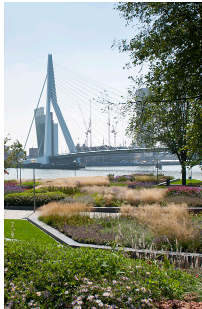
Leuvehouf in Rotterdam, 2011

Een ontwerper die trouw is aan zichzelf dus, maar wel een die begrijpt dat je in de landschapsarchitectuur niet als solist kan opereren. Oudolf heeft zich laten kennen als iemand die ervan geniet om samen te werken, op zoek naar manieren om van het geheel meer dan de som der delen te maken. Uit zijn behoefte kennis en ervaringen met anderen te delen zijn verschillende interessante samen-