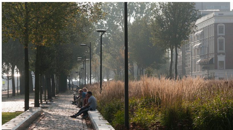
Westerkade in Rotterdam, 2011

Voor Rotterdam, thuisbasis van de Maaskantprijs, heeft Oudolf een speciale betekenis. Hij realiseerde er verschillende projecten: de openbare ruimte 'Leuvehoofd' aan de noordelijke Maasoever (met dS+V), de openbare binnentuin 'Lichtushof' (samen met dS+V en Van Egeraat architecten) en de vernieuwde Westerkade (met OKRA landschapsarchitecten). Projecten die nieuwe kwaliteiten toevoegen aan de internationaal vermaarde hoogbouw- en architectuurstad; die verbindingen leggen, de stad groener maken en de aantrekkingskracht van de openbare ruimte vergroten.