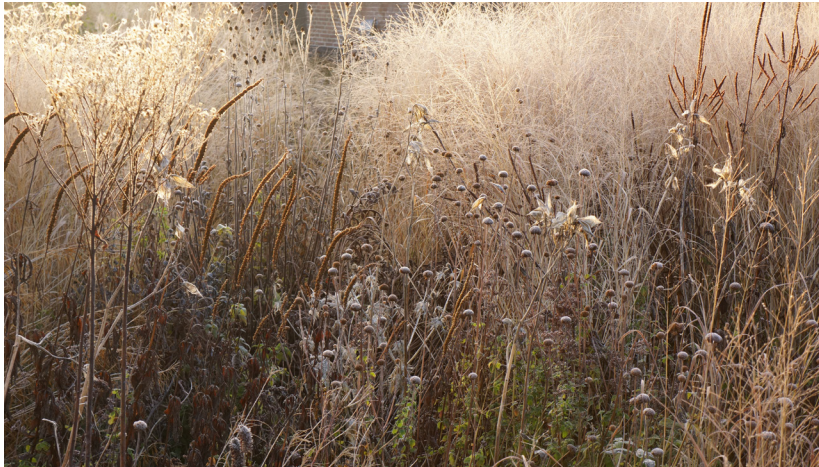
Herfst in Oudolf's tuin in Hummelo

Nieuw in de wereld van de landschapsarchitectuur is de factor tijd. Oudolf is een van de eerste tuinontwerpers die het mooie van uitgebloeide planten ziet. Met betrekking tot zijn eigen tuin zegt hij hierover het volgende: “Je kijkt hiernaar, en het gaat dieper dan wat je ziet. Het herinnert je aan iets in de genen – natuur, of het verlangen naar natuur. [...] De tuin toestaan om te ontbinden geeft invulling aan een emotionele behoefte in mensen. Je ac-