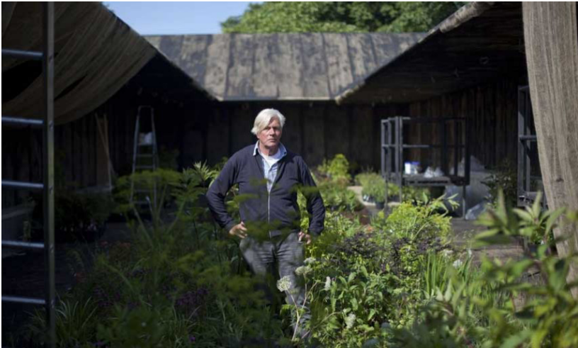
Piet Oudolf in de door hem ontworpen tuin van het Serpentine Paviljoen in Londen (architect: Peter Zumthor), 2011