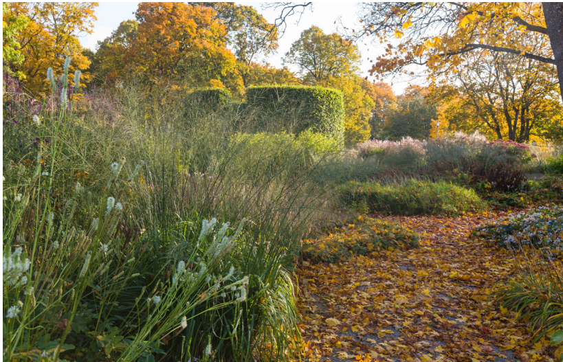
Dream Park in Enköping bij Stockholm (1996)

In 1996 ontmoet hij tijdens een congres een parkdirecteur uit Zweden ontmoete. Deze geeft hem een opdracht voor het ontwerpen van een stadspark in Enköping bij Stockholm. Dream Park heet het, een sprookjesachtig landschap met een spectaculaire ‘rivier’ van paarse Salvia. Het betekent zijn