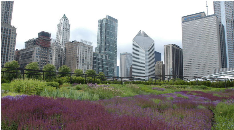
Lurie Garden in Millennium Park, Chicago (2001)

Van een geheel ander karakter is de transformatie van The High Line, ook in New York City (2009). Op initiatief van bewoners uit het Meatpacking District wordt het verwaarloosde spoorviaduct omgebouwd tot een groene promenade. Oudolf wordt door de Amerikaanse landschapsarchitecten benaderd voor de beplanting. Samen met hen zet hij een 'verhaallijn' op voor de 1,6 kilometer lange ruimte, waarin je vanuit een bosachtige sfeer via een open bomengebied naar een weideachtige omgeving loopt. Het onkruid dat de