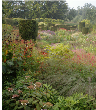
Oudolf's tuin in Hummelo