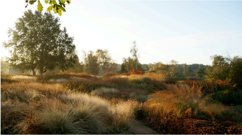
Pensthorpe Waterfowl Trust in Fakenham, Norfolk (200, herzien in 2009)