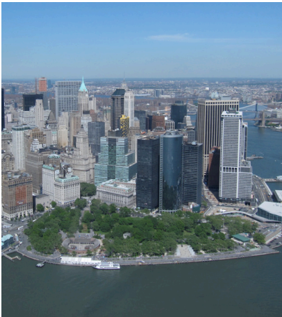
Masterplan voor The Battery in Manhattan, New York met de Gardens of Remembrance, samen met Saratoga landscape architects (2003-2005)

rails overwoekert neemt hij als vertrekpunt, om het gevoel van de originele, ‘spontane’ planten vast te houden. De grassen - Amerikaanse soorten, geplant in ecologische groepen - zijn hier sterk door elkaar gemixt. Het geeft nog veel sterker dan in zijn tuinen, het idee alsof je midden in de stad in een stuk wilde natuur bent beland. Het is volgens kenners hét geheim achter het (wereldwijde) succes van The Highline; de grassen zijn cruciaal geweest voor dat effect.